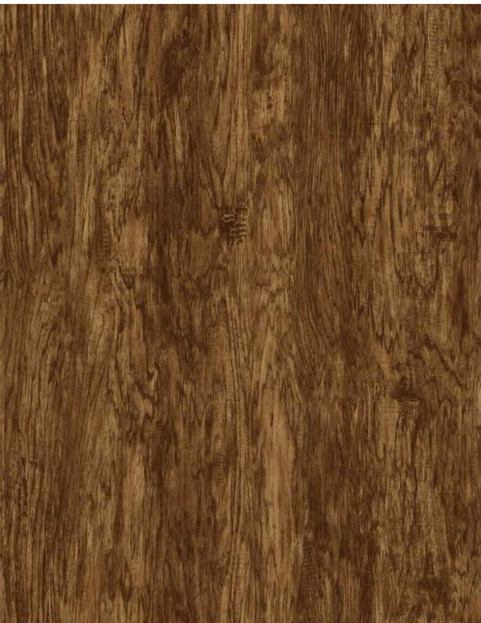
品名：山核桃 型号：RUNM1130-1 规格：1000*1270mm