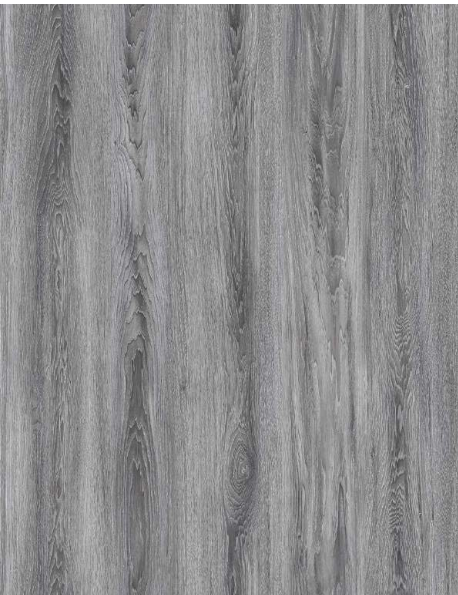
品名：山核桃 型号：RUNM1138-1 规格：1000*1270mm