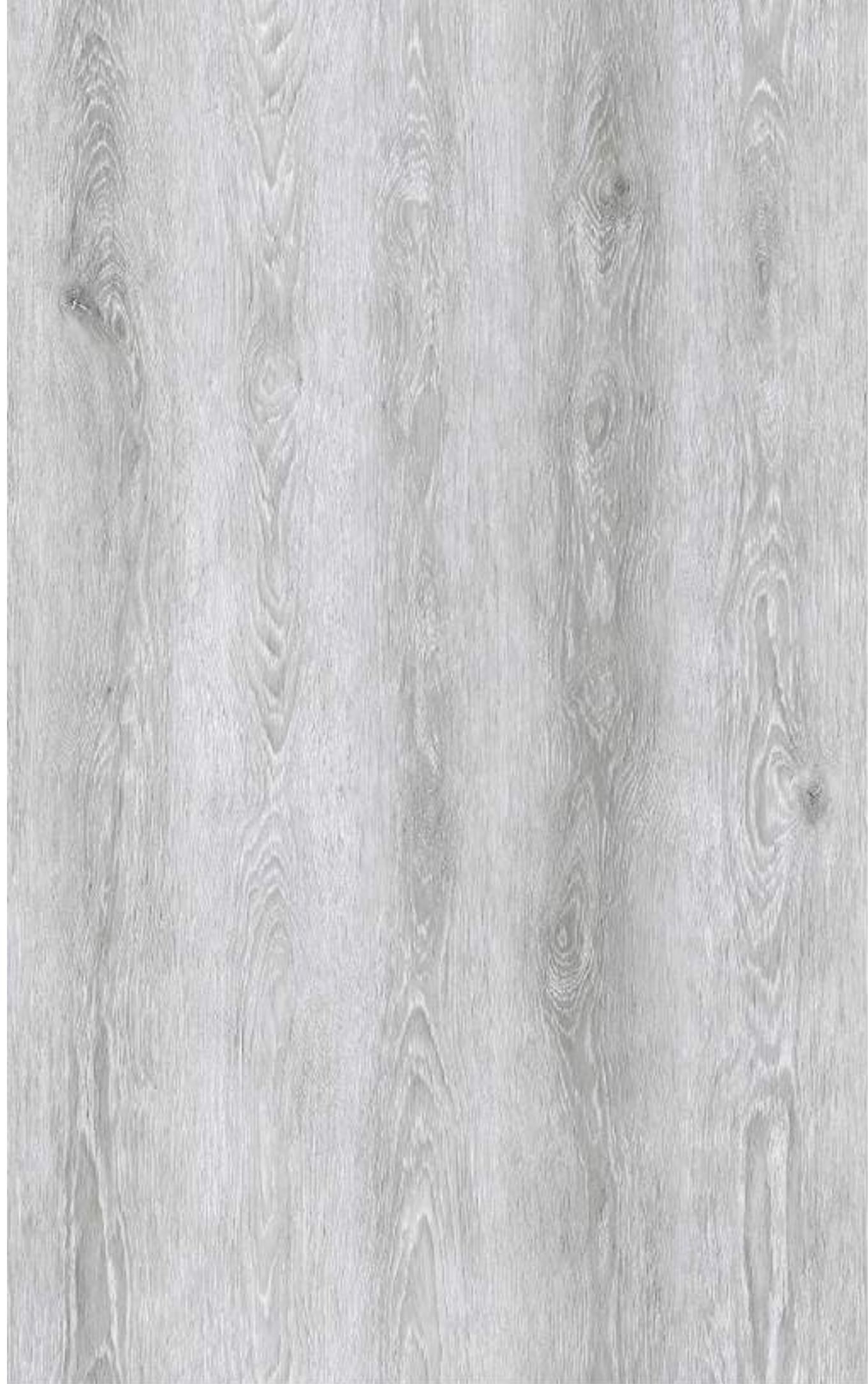
品名：橡木 型号：RUNM1137-1 规格：1000*1580mm