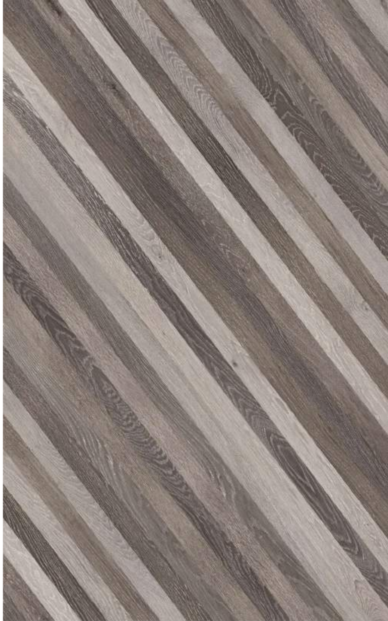
品名：人字拼 型号：RUNM1114B-6 规格：1000*1270mm