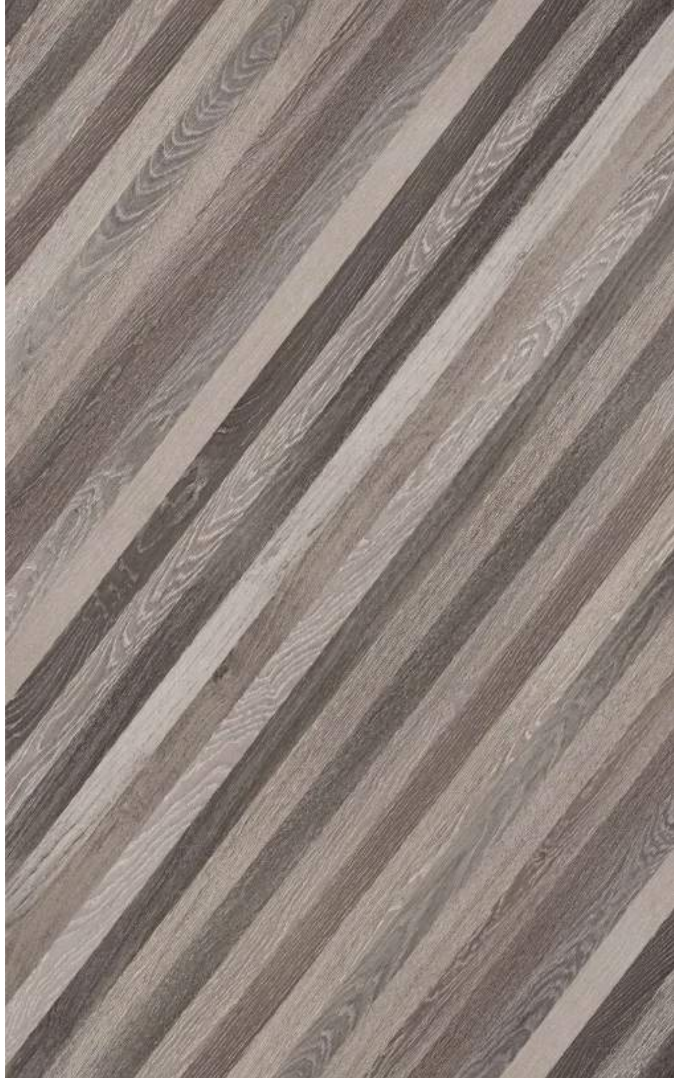
品名：人字拼 型号：RUNM1114A-6 规格：1000*1270mm