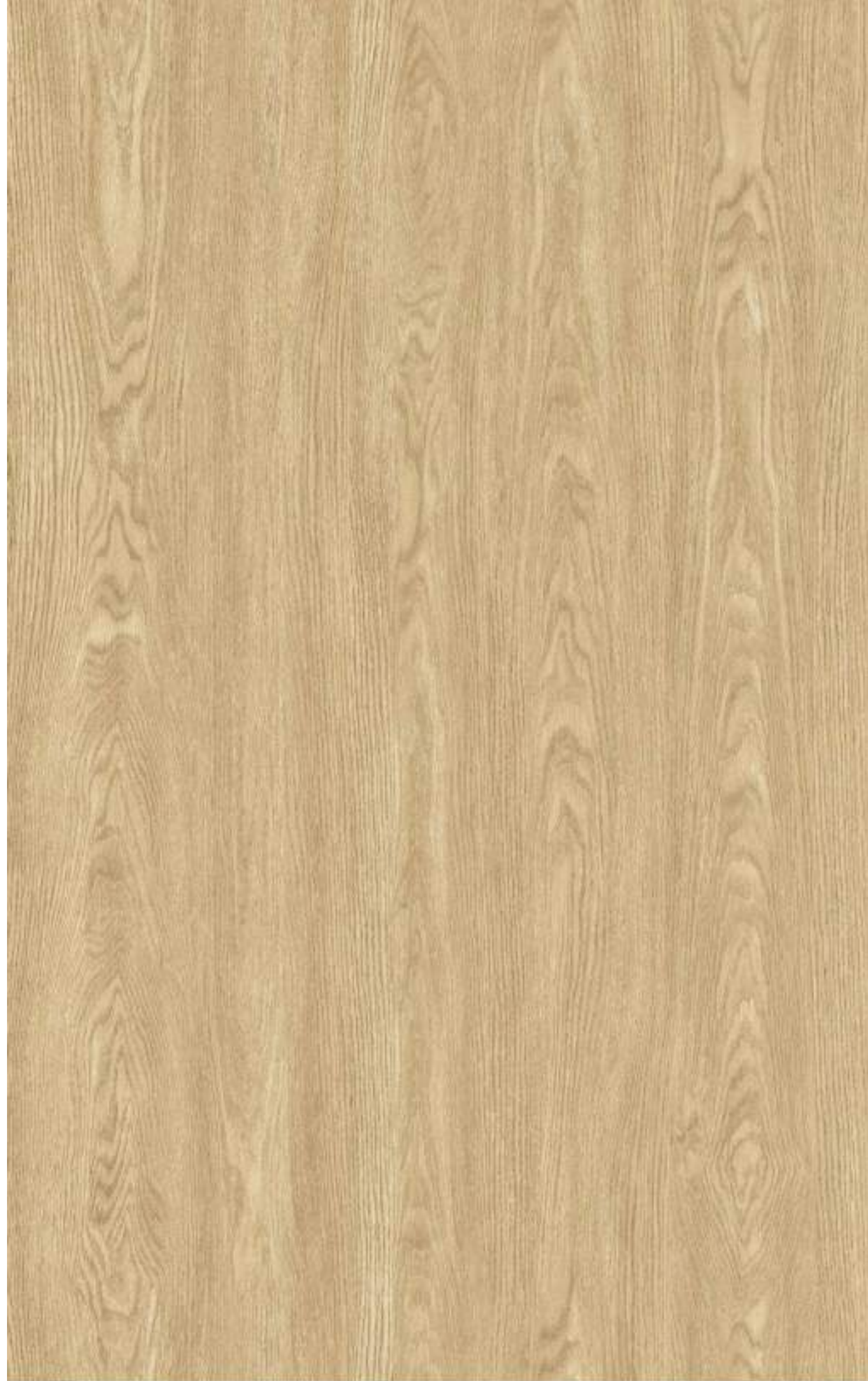
品名：橡木 型号：RUNM1107-2 规格：1000*1580mm